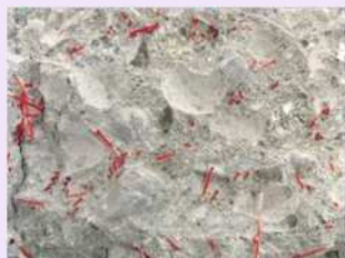
短繊維混入コンクリート