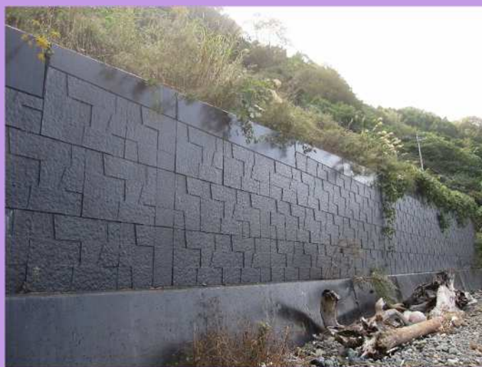
海岸線から0m(2014年施工)