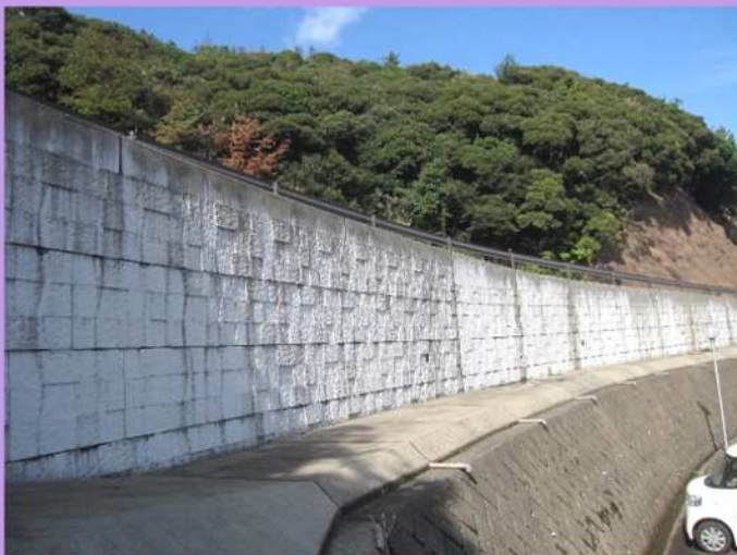
海岸線から80m(2015年施工)