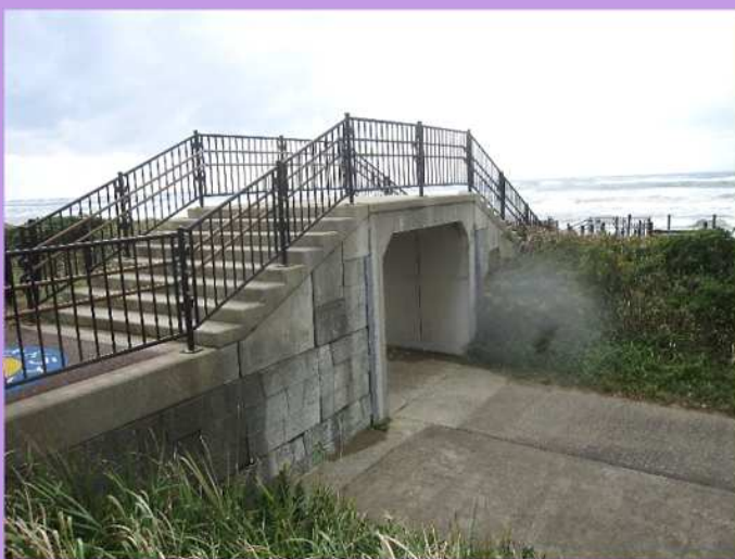
海岸線から30m(2013年施工)